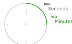
RPOs y RTOs

Realice failover y failback ante desastres o como pruebas de sus planes de contingencia.